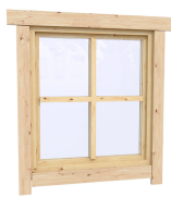
0.87×0.78 м.1 шт.