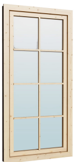
0.84×1.885 м.5 шт.