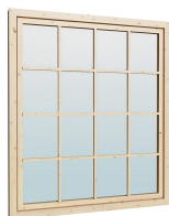
1.62×1.885 м.1 шт.